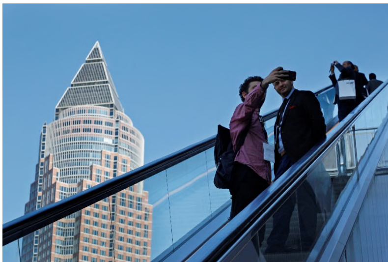
Frankfurt am Main: Tagungsort der diesjährigen Global Assembly und Annual Conference am 19. und 20. Mai 2022.

Die für die Zukunftsstrategien der Aufzug- und Fahrtreppenindustrie relevanten politischen, ökologischen und wirtschaftlichen Leitplanken stehen auf der Agenda der Generalversammlung und der Jahreskonferenz 2022, die der europäische Dachverband der Aufzug- und Fahrtreppenindustrie ELA (European Lift Association) am 19. und 20. Mai 2022 in Frankfurt am Main ausrichtet.